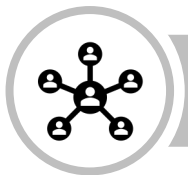
Tableau bietet die Möglichkeit, aus über 75 Datenverbindungen zu wählen. Basierend auf der VizQL-Technologie können Daten intuitiv per Drag & Drop analysiert und visualisiert werden